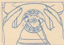
Lösen der Zeichenblende

Mit zwei Fingern hier auf die schräg aufgesetzte Zeichenblende drücken und in Pfeilrichtung drehen.