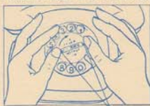
Aufsetzen der Zeichenblende

Mit zwei Fingern hier auf die Zeichenblende drücken und dabei in Pfeilrichtung bis zum Anschlag drehen. Dabei jedoch die Fingerlockscheibe festhalten.